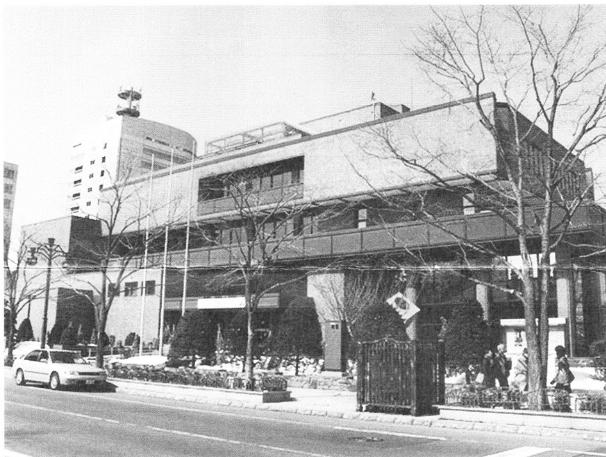
札幌市教育文化会館