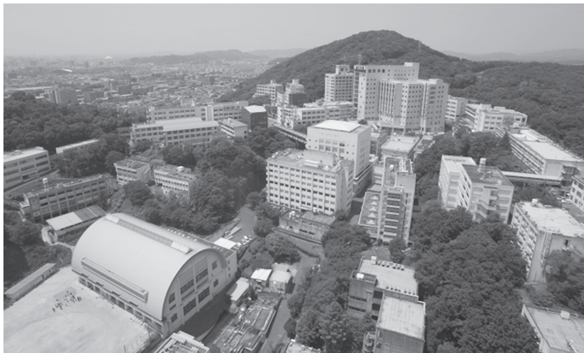
岡山理科大学 岡山キャンパス